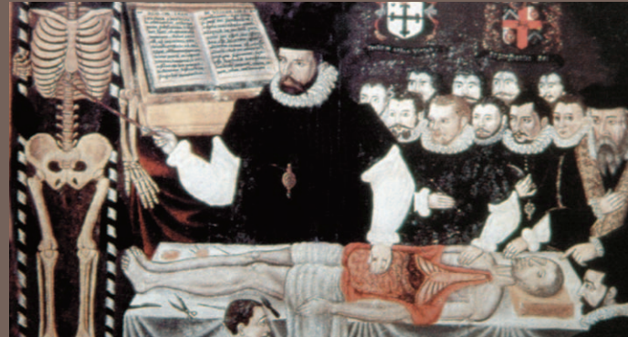
Verejná pitva, kresba zo 16. storočia