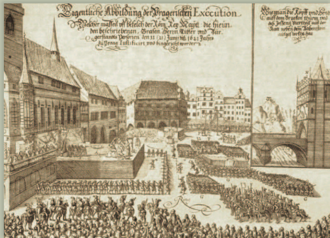
Poprava 27 českých páňov na Staromestskom námestí

Roku 1621 bolo bitkou na Bielej hore potlačené povstanie českých stavov a došlo ku krutým represáliám. Jessenius bol obvinený z rebélie a urážky majestátu a odsúdený na trest smrti. Bol popravený spolu s ďalšími 26 českými páňmi na Staromestskom námestí v Prahe 21. júna 1621.