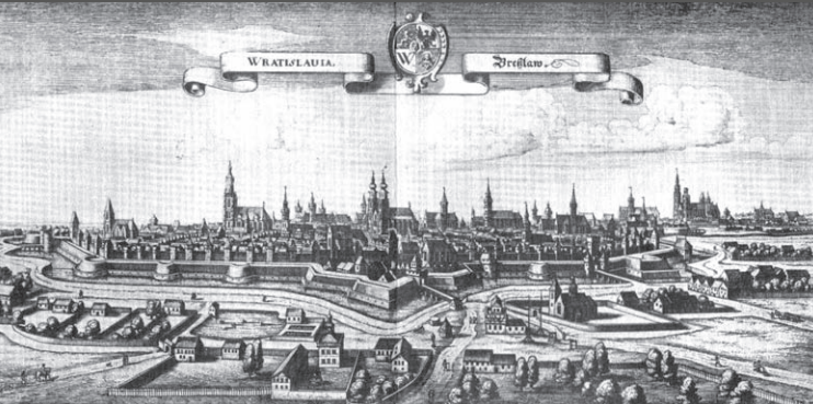
Dobová veduta Vratislava