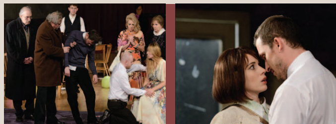
Božena Slančíková Timrava, Daniel Majling: Bál, fotografie z predstavenia inscenácie v SND

Pacifistickú novelu Hrdinovia (1918) písala ako súťažnú prácu, v ktorej sa usilovala vyjsť v ústrety spoločenským očakávaniam, čo do istej miery znižuje jej umeleckú vierohodnosť. Vynikajúcim textom je novela o ľudskej biede, slabosti a utrpení Skon Paľa Ročku (1921). Polemickou autorky s oficiálnou martinskou koncepciou literatúry a s patetickým vzťahom k národu a folklóru je románová novela Všetko za národ (1926). V ďalších novelách Dve doby (1936) a Záplava (1938) s iróniou zobrazuje zmenené spoločenské pomery v novej republike. Príležitostne písala aj divadelné hry, tie však nedosiahli úroveň jej próz.