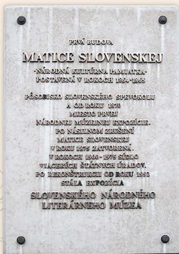
Pamätná tabuľa na prvej budove Matice slovenskej

Činnosť Matice slovenskej bola obnovená 1. januára 1919. Usilovala sa nadviazať na svoju predchádzajúcu prácu. V päťdesiatych rokoch 20. storočia bola ohrozená jej existencia a ochromená jej činnosť. V súčasnosti sú jej aktivity zamerané najmä na upevňovanie slovenského vlastenectva, prehlbovanie vzťahu občanov k slovenskej štátnosti a realizáciu slovakistického výskumu. Podieľa sa tiež na rozvoji miestnej a regionálnej kultúry, stará sa o krajanov žijúcich v zahraničí, podporuje propagáciu Slovenskej republiky, vydáva pôvodnú slovenskú umeleckú tvorbu, vedecké diela a spolupracuje pri tvorbe učebníc a učebných textov pre základné a stredné školy.