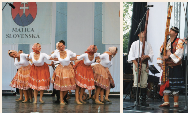
Národné matičné slávnosti