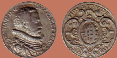
Kristián I., kurfiřt saský