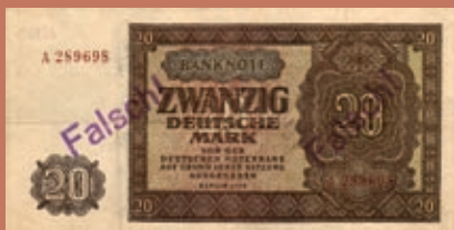
Padělky východoněmecké měny