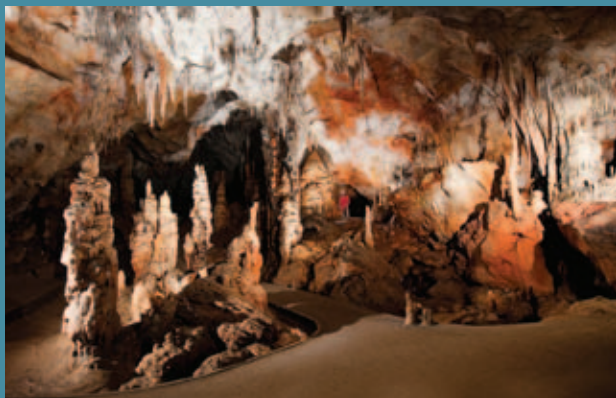
Dóm indických pagod v Domici

Na území Slovenského a Aggteleckého krasu sú známe aj jaskyne, v ktorých sa zachovali pamiatky reprezentujúce vývoj viacerých kultúr pravekého človeka. Mimoriadne sú stopy po osídlení ľudí bukovohorskej kultúry v Domici s hrnčiarskou dielňou, stopami po dolovaní hliny, nálezmi keramiky, ihiel na šitie z kostí a rôznych ďalších predmetov. Jednoduché nástenné kresby sa zachovali v Ardotskej jaskyni a v Archeologickom dome Silickej ľadnice. Osobitne vzácne sú kultové masky kyjatickej kultúry vyhotovené z ľudskej lebky z Majda-Hraškovej jaskyne a z Babskej diery. V mnohých ďalších jaskyniach boli nájdené početné predmety z neskorej doby bronzovej, z doby železnej, halštatskej a zo stredoveku. Z historických pamiatok je významný aj husitský nápis v Jasovskej jaskyni.