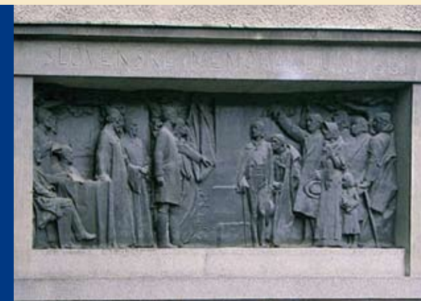
Reliéf na budove evanjelického kostola v Martine, pred ktorým sa konalo memorandové zhromaždenie (autor akad. sochár Ján Koniarek)