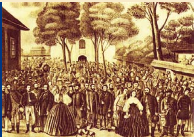
Dobové zobrazenie memorandového zhromaždenia, na ktorom sa zúčastnilo päťtisíc ľudí

Hoci požiadavky Memoranda zostali nenaplnené, malo mimoriadny význam pre identitu, sebauvedomenie a národný vývin Slovákov. Ukázalo schopnosť a pripravenosť vedúcich slovenských činiteľov aktívne vystupovať za národné záujmy a prezentovať ich príslušnými politickými, teoretickými a právnymi argumentmi. Memorandový program, najmä jeho princípy národnej identity a rovnoprávnosti, tvorili základnú platformu riešenia slovenskej otázky a národnej emancipácie až do rozpadu Rakúsko-Uhorska roku 1918.