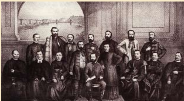
Členovia delegácie, ktorá predložila Memorandum uhorskému snemu