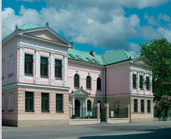
Múzeum Andreja Kmeťa v Martine

Andrejovi Kmeťovi patrí popredné miesto ako zakladateľovi Slovenského národného múzea, ako aj myšlienkovému tvorcovi a iniciátorovi založenia Muzeálnej slovenskej spoločnosti (1893), ktorej hlavným programom bola záchrana pamiatok národnej minulosti. Ako prvý a doživotný predseda spoločnosti naplňal jej vlastivedný zberateľsko-muzeálny program. Jeho rozsiahle zbierky archeológie, ľudovej kultúry, histórie, živej aj neživej prírody sa stali základom zbierok prvého národného múzea Slovákov. Jeho zásluhou boli položené v Turčianskom Sv. Martine základy prvej účelovej budovy Slovenského