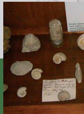
Exponáty z geologickej zbierky