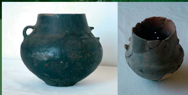
Archeologické vykopávky z Beše