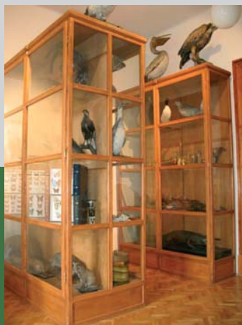
Expozícia múzea A. Kmeťa