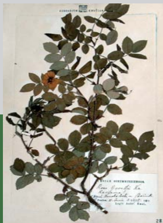
Ukážka z herbára