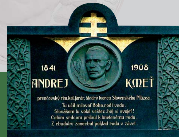
Pamätná tabuľa na fare v Prenčove